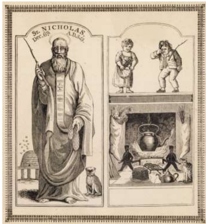
John Pintard megbízásából Alexander Anderson Szent Miklós nyomtatása (1810)

1804-ben John Pintard, befolyásos hazafi megalapította a New York-i Történelmi Társaságot, és Szent Miklóst a város védőszentjévé tette. 1810 december 6-án a társaság rendezte meg az első Szent Miklós ünnepet. Pintard megbízta Alexander Anderson művészt, hogy rajzoljon képet a szentről. Anderson továbbra is egyházi alakként mutatták be, és egyértelműen ajándékokat is ábrázolt vele kapcsolatban. A gyerekek jutalmazására szánt ajándékokat a kandalló szélére helyezett harisnyákba helyezte. Hogy miért? Mert Szt. Miklós, az amerikai Sancte Claus a kandalló kéményébe dobta be ajándékait, amik azután az odahelyezett harisnyákban landoltak.