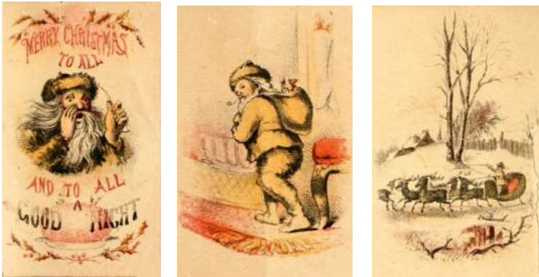
Illusztrációk Clement Moore „Szent Miklós látogatása” című verses könyvének 1864-es kiadásából

A szánkót húzó és repülni tudó rénszarvasok eredetére később visszatérünk.