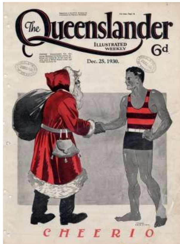
Ausztráliában a strandon köszöntik a Mikulást