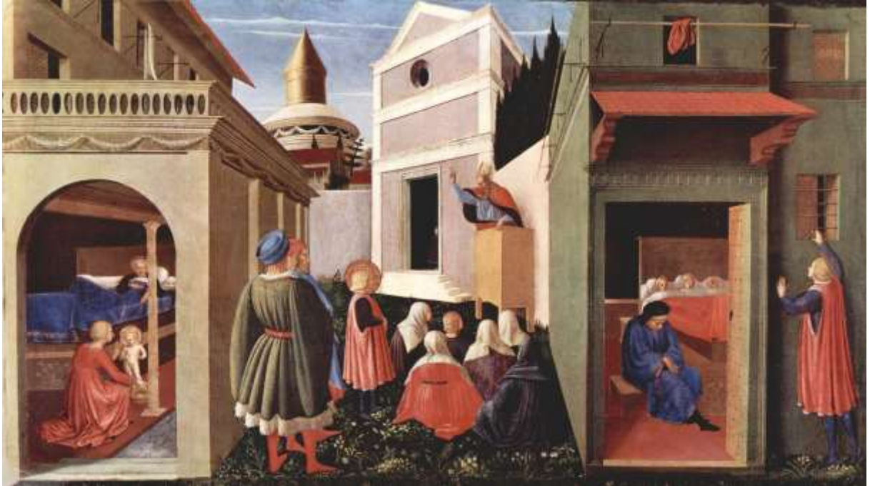
Fra Angelico: A három szűz férjhez adása című festménye

szegény ember, aki nem tudta férjhez adni három lányát, mert nem volt pénze hozományra. A dolog Miklós fülébe is eljutott, ám a püspök túl szerény volt ahhoz, hogy nyíltan segítsen. Az éjszaka leple alatt három erszényt dobott be az apának, így a lányok megmenekedtek attól, hogy örömlánynak adják őket. Nem hivatalos legenda szerint a pénzeket az ablakon dobta be, amik éppen a lányok cipőibe hullottak. Innen eredeztetik, hogy a Mikulás az ablakba kitett (és szépen kipucolt) cipőkbe hozza az ajándékokat.