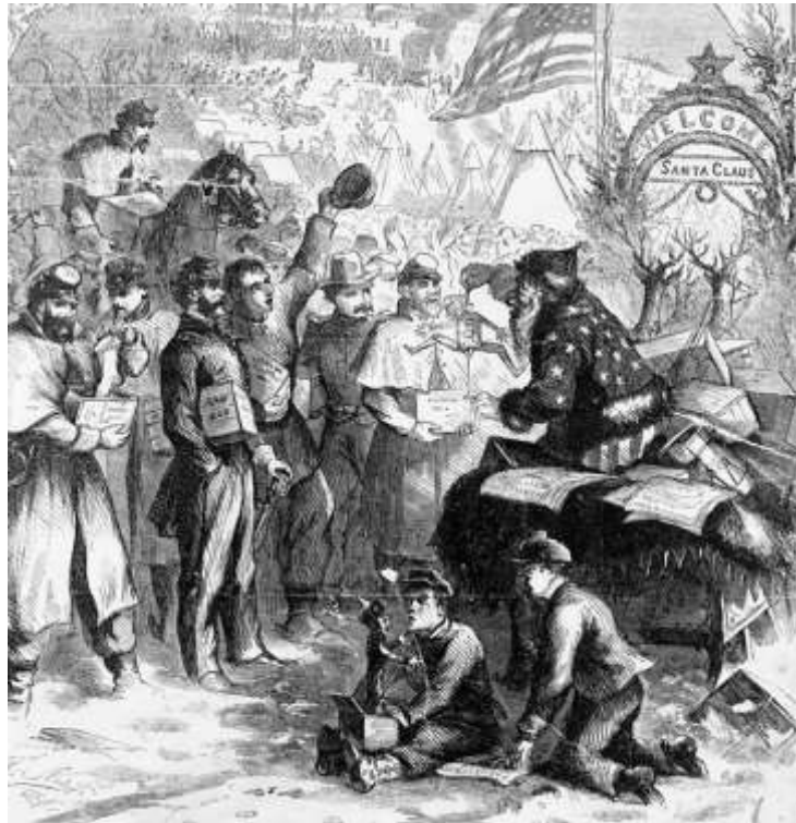
Thomas Nast "A Christmas Furlough" rajza, a Harper's Weekly 1863-as számának címlapján.

Idővel egyre több helyen és egyre több reklámplakáton szerepelt a Mikulás figura. Thomas Nast német származású amerikai karikaturistának köszönhetjük a Mikulás modern változatának megszületését. Első ilyen rajza a Harper's Weekly 1863-as számában jelent meg a „karácsonyi fenyő” nevű illusztráció részeként. Később Nast lerajzolta a Mikulás északi otthonát, a játékgyárat és benne az óriási könyvet, amelyben minden jó és rossz gyerek neve szerepel. Ám ekkor a Mikulás bundája még nem piros, hanem különféle színekben – kék, zöld és sárga – színekben jelenik meg.