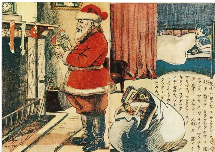
Japán újság illusztrációja 1918-ból.

Távolkeleti sikereket is elkönyvelhet magának a Mikulás, Plakáton szerepelt Japánban 1918-ban. De eljutott Ausztráliába is, ahol az ottani nyári hőségben sem akar megválni hagyományos téli öltözékétől.